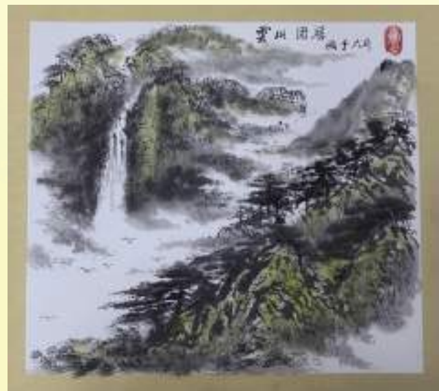
孔宪玉《云山固居》绘画类第三名